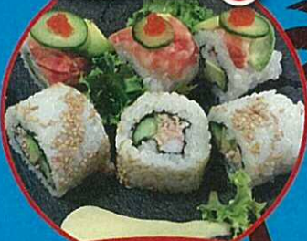
見栄え華やか カリフォルニアロール