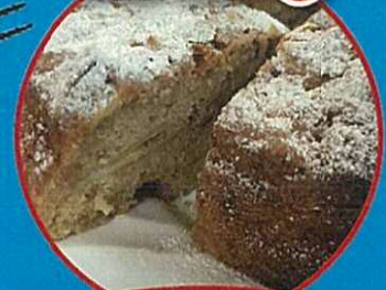
太陽の恵みいっぱい アップルケーキ