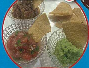
3種のタコディップ トルティーヤ・チップス添え